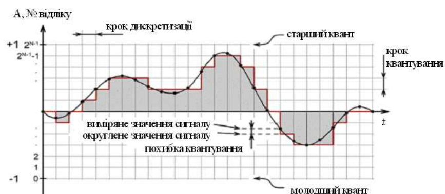
Рис. 5.1. Квантування неперервних сигналів по амплітуді [4]

де оператор \text{int}[\bullet] повертає округлене значення виразу в дужках. Квантування за амплітудою – це процес заміни реальних (вимірних) значень амплітуди сигналу значеннями, наближеними з деякою точністю. Кожен з можливих рівнів називається рівнем квантування, а відстань між двома найближчими рівнями квантування називається кроком квантування. У випадку лінійного розбиття амплітудної шкали на рівні, квантування називають лінійним (однорідним). Пристрій, який здійснює квантування за рівнем та оцифрування квантів називається аналогово-цифровим перетворювачем (АЦП). Кількість рівнів квантування визначається розрядністю АЦП, тобто кількістю двійкових символів, якими буде представлятися один дискретний відлік. Для трьохрозрядного АЦП таких рівнів буде 2^3 = 8 , для вісьмирозрядного - 2^8 = 256 . На рис. 5.1. наведено приклад такого квантування.